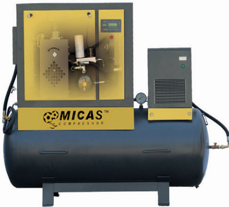
■ HSS 15-CFD