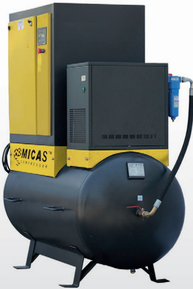
■ HSS 11-CFD